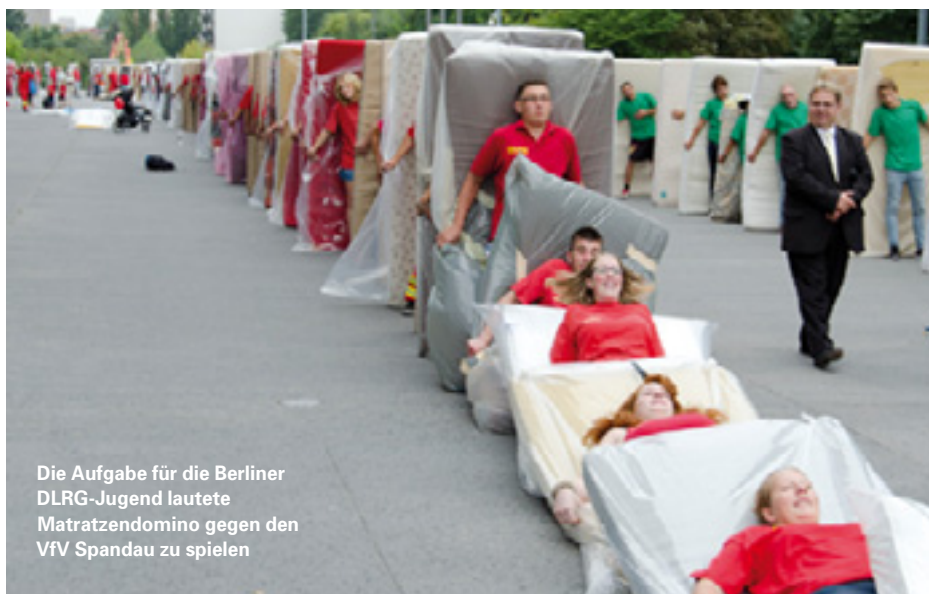
Die Aufgabe für die Berliner DLRG-Jugend lautete Matratzendomino gegen den VfV Spandau zu spielen