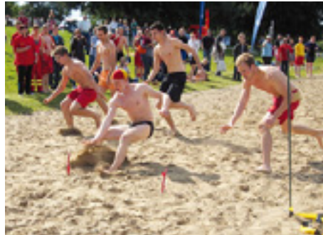
... Beach-Flags am Strand