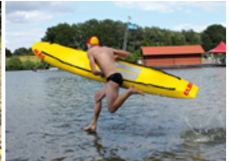
... sowie das Retten mit dem Rettungsbrett