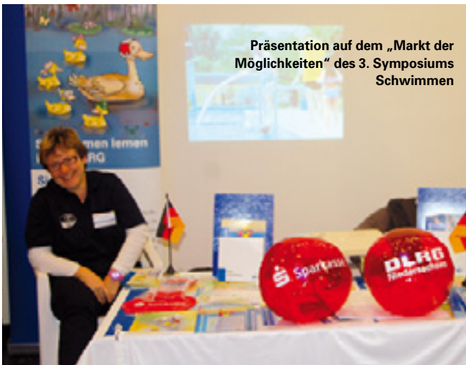
Präsentation auf dem „Markt der Möglichkeiten“ des 3. Symposiums Schwimmen