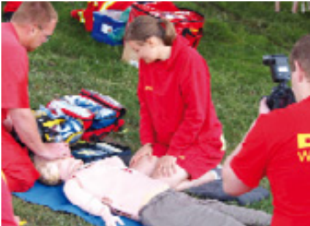
Wettkampfdisziplinen sind u.a. die Reanimation