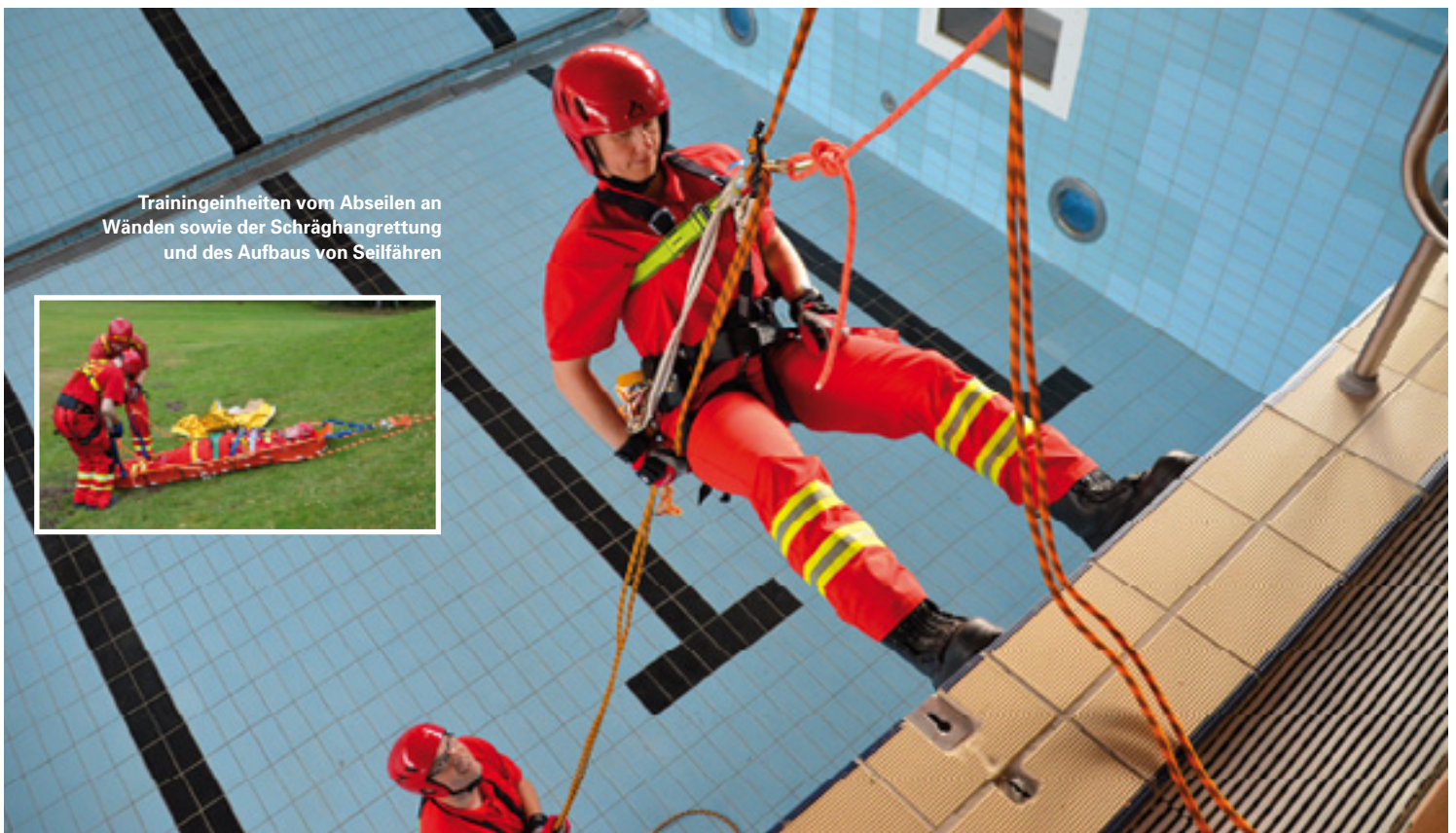
Trainingseinheiten vom Abseilen an Wänden sowie der Schräghangrettung und des Aufbaus von Seilfähren