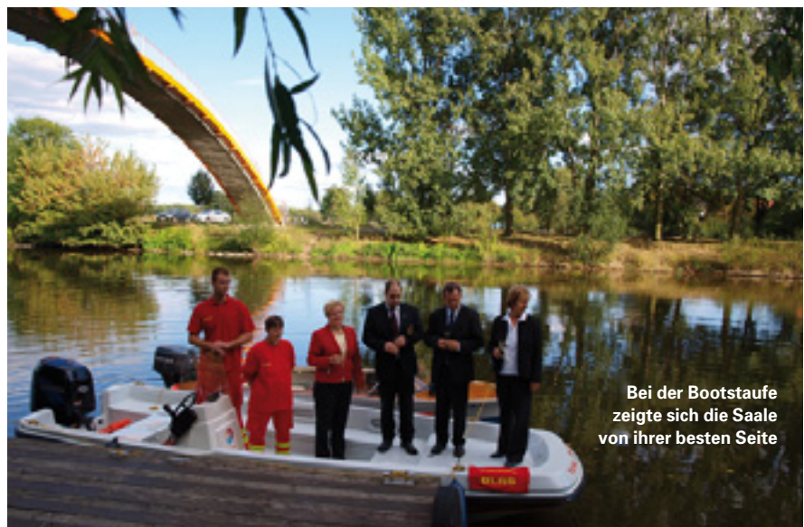
Bei der Bootstaufe zeigte sich die Saale von ihrer besten Seite