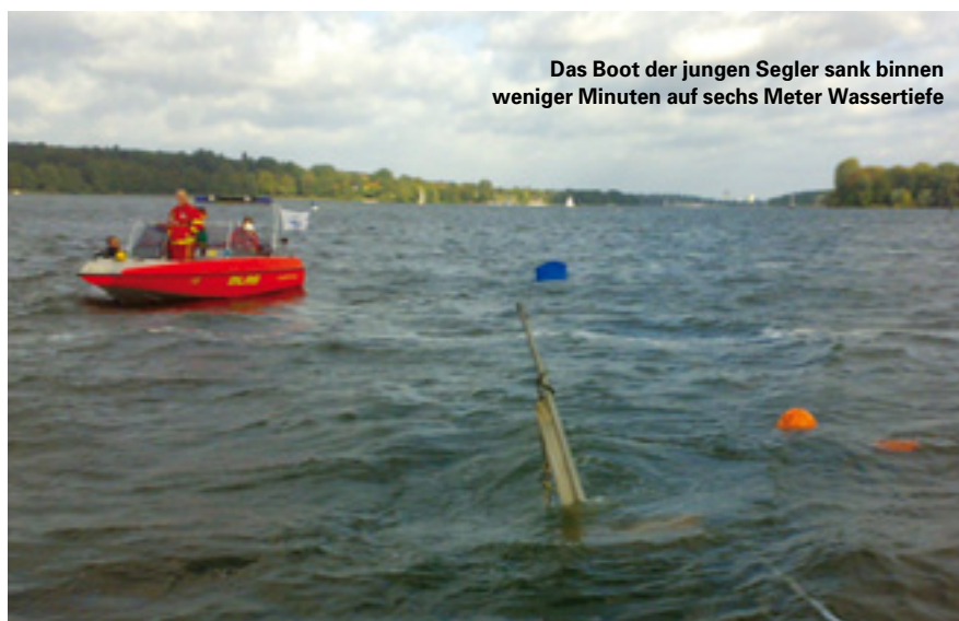
Das Boot der jungen Segler sank binnen weniger Minuten auf sechs Meter Wassertiefe