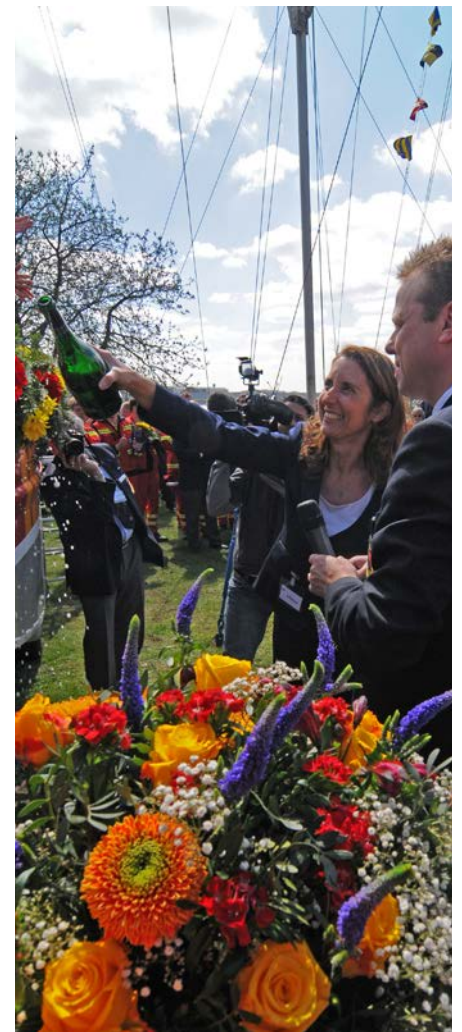
Unter viel Applaus taufte die Hamburger Bundestagsabgeordnete Aydan Özoğuz das neue Motorrettungsboot mit ein paar kräftigen Spritzern Champagner auf den Namen »Greif 5«.

lange Boot war von der Hamburger Sparkasse (Haspa) finanziert worden und ist mit einem Tiefgang von 35 Zentimetern sowie einem auf 50 KW gedrosselten Außenbordmotor ideal für den Einsatz auf der Alster proportioniert. Das Kunststoffboot ist kippstabil und selbstlenzend. Mit großem Arbeitsbereich und viel Stauraum ist es für den professionellen Einsatz konzipiert und gebaut.