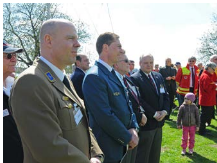
Neben vielen Besuchern und Schaulustigen verfolgten auch zahlreiche Repräsentanten von Polizei, Feuerwehr und befreundeten Hilfsorganisationen die Indienststellung der Einheiten.

lange Boot war von der Hamburger Sparkasse (Haspa) finanziert worden und ist mit einem Tiefgang von 35 Zentimetern sowie einem auf 50 KW gedrosselten Außenbordmotor ideal für den Einsatz auf der Alster proportioniert. Das Kunststoffboot ist kippstabil und selbstlenzend. Mit großem Arbeitsbereich und viel Stauraum ist es für den professionellen Einsatz konzipiert und gebaut.